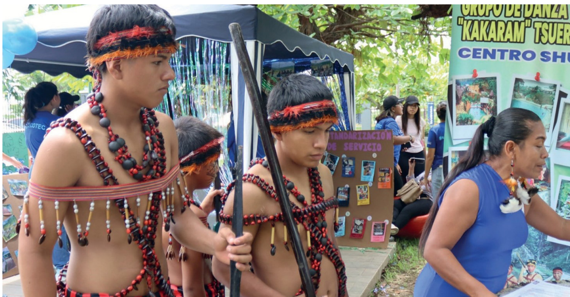
Samborondón. La comunidad shuar visitó las instalaciones de la Universidad Ecotec en la feria de Vinculación