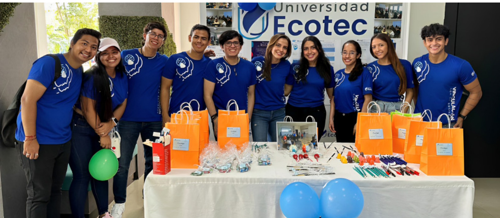
Samborondón. Estudiantes de psicología compartieron sus experiencias en la feria de vinculación

Siendo cada uno de estos, procesos mentales padecidos por la muestra poblacional escogida por los psicólogos en preparación.