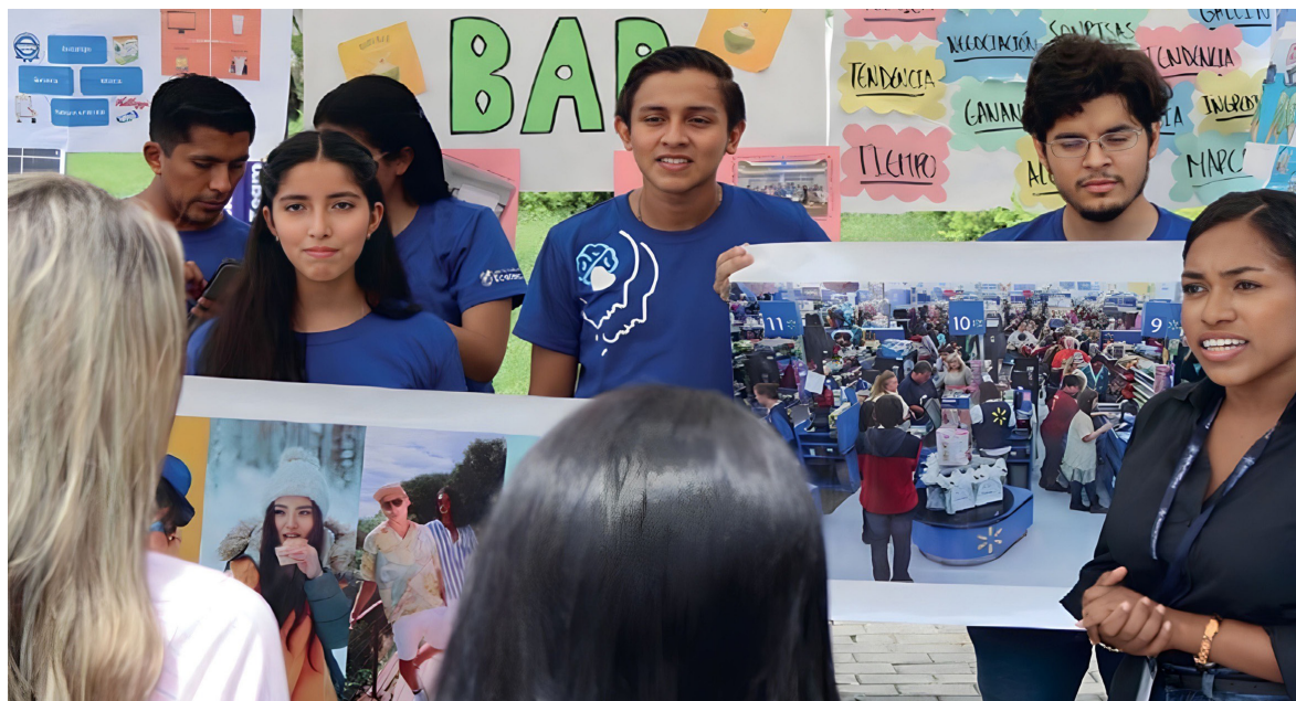
Samborondón. Estudiantes de ciencias económicas presentaron su proyecto "Mi barrio emprende".