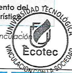
Cuadro # 1: Integración de Dominios, Líneas de investigación y Programas de Vinculación